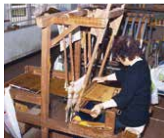
はたおき 機織り機