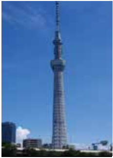
とうきょう 東京スカイツリー