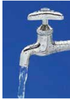
きゆうすいせん みず 給水栓と水